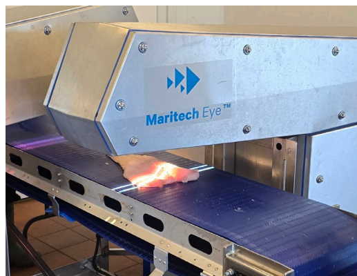
Figur 2 Skanning av filetrøver med Maritech Eye

Hyperspektrale bilder ble tatt av filetrøvene på land innen 2-8 døgn etter fangst med Maritech Eye hyperspektralt kamerasystem (Maritech AS, Molde, Norge). Kameraet bestod av et Hyspex Baldur V-1024 N (Norsk Elektro Optikk, Oslo, Norge) som måler 88 spesifikke bølglengder i spekteret 493 nm til 945 nm. Kameraet registrerer 512 piksler linje for linje i x-aksen, mens prøven beveger seg langs y-aksen som gir et to dimensjonalt bilde av prøven og hvor den spektrale informasjonen kan regnes som den tredje dimensjonen. Både filet-siden og skinn-siden av prøvene ble scannet.