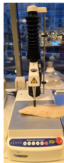
Figur 3 Til venstre: Grafen viser rådata fra teksturmåler. Til høyre: Teksturmåling av filetrøve