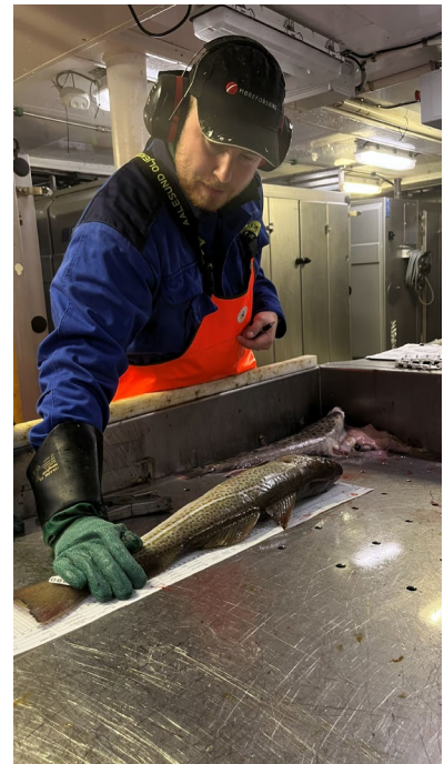
Figur 1 Måling av prøver om bord M/Tr Havtind

Tokt sommerhalvåret ble gjennomført i perioden 30.09.2025 – 14.10.2025 om bord tråleren M/Tr Havtind (Nordland Havfisk AS). Prøvene ble samlet inn utenfor kysten av Øst-Finnmark nær Russlands grense. Totalt ble det samlet inn prøver fra 60 torsk og de samme analysene som på vintertoktet ble gjennomført i lik rekkefølge.