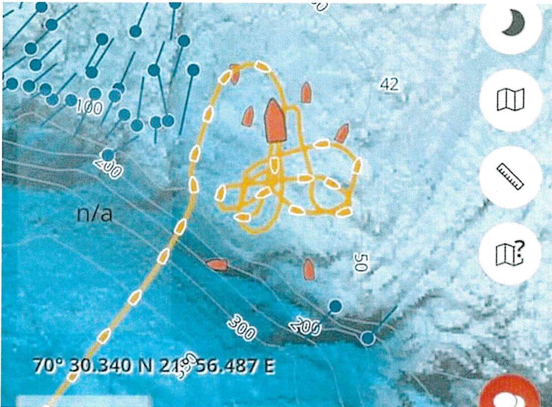
Figur 1. Kilde: https://www.ifinnmark.no/5-81-1548482 ; «STOR OG LITEN: Slik så det ut i Breivikfjorden i dag tidlig. Den store båten er en 90-fots båt som ikke leverer fisken på land.»

Kartutsnitt fra Breivikfjorden, fra oppslaget på https://www.ifinnmark.no/5-81-1548482 om at «Små og store båter kjemper om den samme fisken: – Vi fisket aldri så langt inn» (se vedlegg):