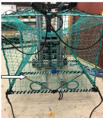
Figur 1. Rømmingshull monterert i trekkretning av teinen.

For å redusere press på bomullstråden (fra vekten av fangsten) når teinen hales opp og tas om bord, anbefales det å montere rømmingshullet på den siden av teinen som løftestroppene er rettet mot (trekkretning), se Figur 1. Alternativt kan rømmingshullet lages på en av tverrsidene (inngangssidene), se Figur 2.