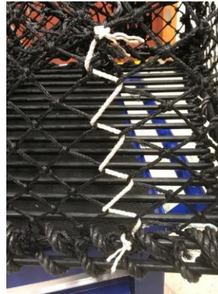
Figur 6: Hullet i figur 5 er sydd sammen med bomullstråd.