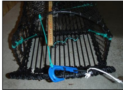
Figur 4: Minimum åpning begrenses av lengden på festetauet for kroken.