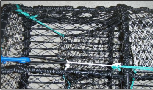
Figur 3: Feste av bomullstråd mellom strikk og tau.

Ved bruk av denne løsningen kreves det at plastkroken, som holder tømmeluku lukket, festes med et kunstfibertau i teinens hovedramme. Tauet skal være langt nok til å lage en åpning på minst 15 cm for tømmeluku når bomullstråden slites. Se figur 4.