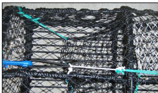
Figur 3: Feste av bomullstråd mellom strikk og tau.

Ved bruk av denne løsningen kreves det at plastkroken, som holder tømmelukuken lukket, festes med et kunstfibertau i teinens hovedramme. Tauet skal være langt nok til å lage en åpning på minst 15 cm for tømmelukuken når bomullstråden slites. Se figur 4.