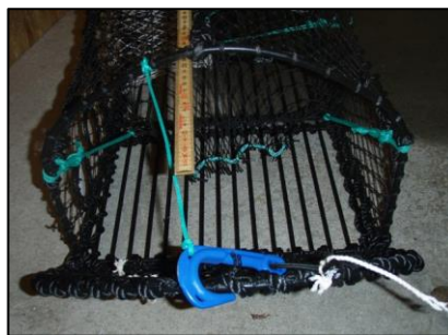
Figur 4: Minimum åpning begrenses av lengden på festetauet for kroken.