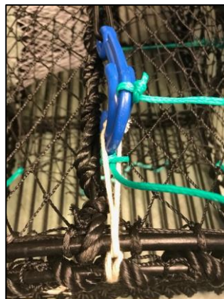
Figur 2: Feste av plastkrok på trådløkken.