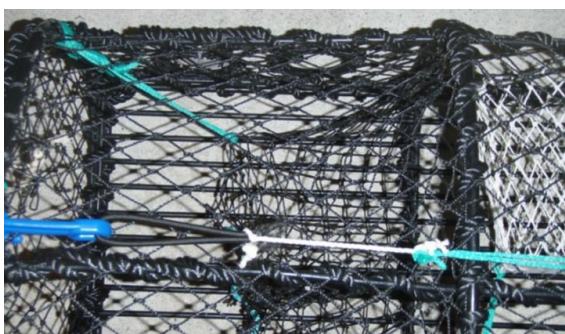
Figur 2. Bomullstråd mellom strikk og låsekrok.