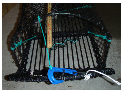
Figur 9: Minimum åpning begrenses av lengden på festetauet for kroken.