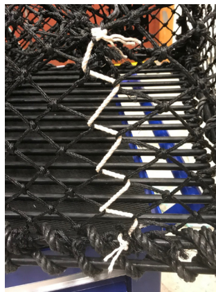
Figur 2: Hullet i figur 1 er sydd sammen med bomullstråd.

Dersom teinen har oppbevaringskammer (se figur 3 og 4), skal hullet være i dette. For teiner med flere enn ett oppbevaringskammer, skal det være hull i samtlige.