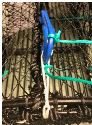
Figur 6: Feste av plastkrok på trådløkken.