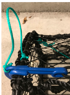
Figur 8: Feste av plastkrok med tau i teinens ramme.