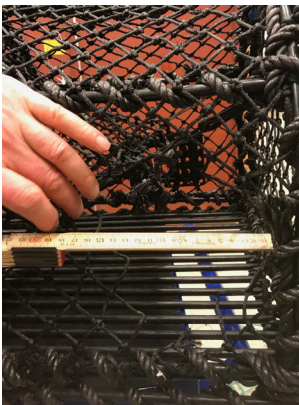
Figur 1: Eksempel på hull skåret i sideveggen på teinen.

Hullet skal deretter sys igjen med bomullstråd, som bare festes i begge ender. Se eksempel i figur 2.