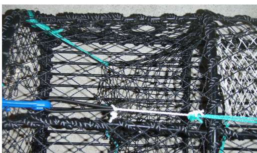
Figur 7: Feste av bomullstråd mellom strikk og tau.

Ved bruk av denne løsningen kreves det at plastkroken, som holder tømme-luken lukket, festes med et kunstfibertau i teinens hovedramme. Se figur 8. Tauet skal være langt nok til å lage en åpning på minst 15 cm for tømme-luken når bomullstråden slites. Se figur 9.