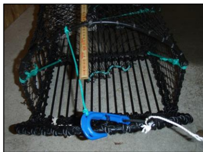
Figur 4: Minimum åpning begrenses av lengden på festetauet for kroken.