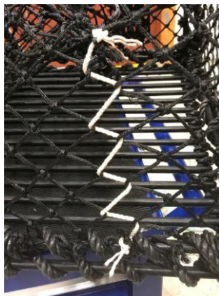
Figur 6: Hullet i figur 5 er sydd sammen med bomullstråd.