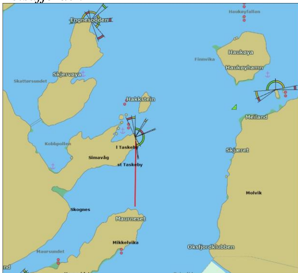
Figur 4: Åpning for notfiske etter sild innenfor fjordlinjen i Kvænangen og Reisafjorden

Etter fangstkontroller 17. november 2022 ble det bestemt å midlertidig åpne for fartøy som har adgang til å delta i kystfartøygruppen å fiske norsk vårgytende sild med not innenfor fjordlinjene i Kvænangen og Reisafjorden avgrenset mot vest av en rett linje mellom følgende posisjoner, se figur 4: