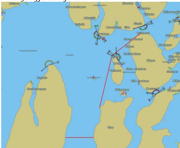
Figur 3: Åpning for notfiske etter sild innenfor fjordlinjene i

Fiskeridirektoratet mottok henvendelse fra Norges Fiskarlag 31. oktober der det ble vist til at det var kommet forekomster av norsk vårgytende sild i Kvæningenområdet og at det snart kunne bli behov for tilgang for områdene innenfor fjordlinjene for ikke å bli hindret i et effektivt sildefiske. Det ble derfor bedt om at Fiskeridirektoratet satte i verk prosess med å få etablert unntak fra fjordlinebestemmelsene i Kvæningen-området slik at sildefisket kunne utøves innover i fjordsystemet. Etter at Fiskeridirektoratets sjøtjeneste og Kystvakten hadde fulgt fisket tett og gjennomført fangstkontroller ble det 9. november funnet grunnlag for å midlertidig åpne for fiske etter norsk vårgytende sild med not innenfor fjordlinjene i Lyngenfjorden for fartøy som har adgang til å delta i kystfartøygruppen, uavhengig av fartøylengde. Den midlertidige åpningen ble avgrenset mot øst og sør med rette linjer mellom følgende posisjoner: