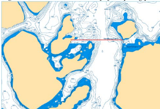
Figur 4: Oversiktskart over linje for åpning på Reisa fjorden per 23.01.19

23. januar var det grunnlag for å endre området på Reisa fjorden i Troms for fiske etter sild, se figur 4.