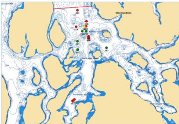
Figur 3: Oversiktskart over stenging av et område på Kvæningen og Reisafjorden 18.01.2019