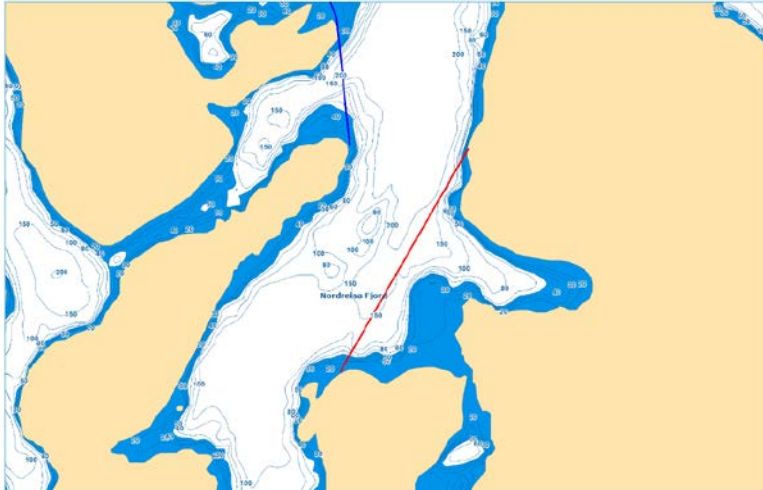
Figur 2: Oversiktskart for stengt område på Reisa fjorden i Troms per 10.12.2018