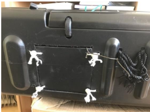
Figur 4. Luken er festet med bomullstråd i fire hjørner. I ett av festepunktene er det i tillegg en tråd av kunstfiber.