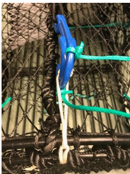
Figur 2. Låsekroken hukkes i løkke av bomullstråd.