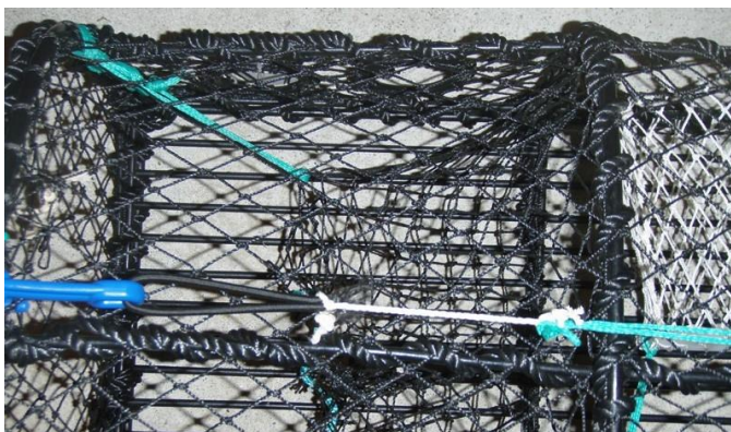
Figur 3. Bomullstråd mellom strikk og låsekrok.