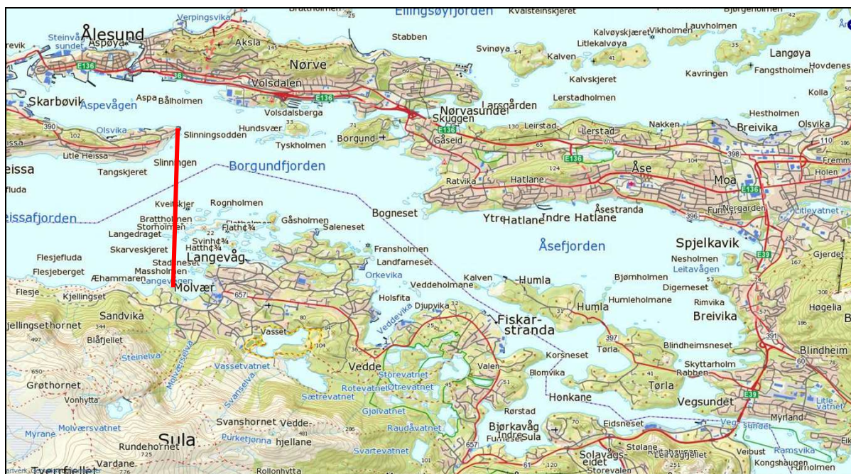
Figur 1: Fiskeforbudet omfatter Borgundfjorden, inkludert Aspevågen, avgrenset mot vest av en linje trukket sørover fra Slinningsodden og i øst av Vegsundet bru.

Forbudet i Borgundfjorden innebærer at det ikke er tillatt å drive noen form for fiske etter torsk eller andre arter i dette tidsrommet, med unntak av fiske med håndsnøre og fiskestang. Det aktuelle området inkluderer Aspevågen, og avgrenses av en rett linje trukket fra Slinningsodden og sørover til et punkt vest av Langevåg. I øst avgrenses området av Vegsundet bru, se figur 1.