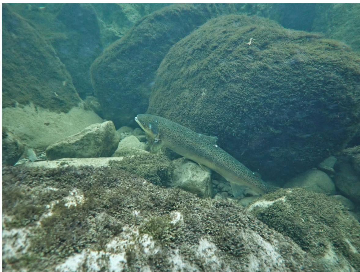
Rømt oppdrettslaks observert ved drivtelling i Æneselva høsten 2019