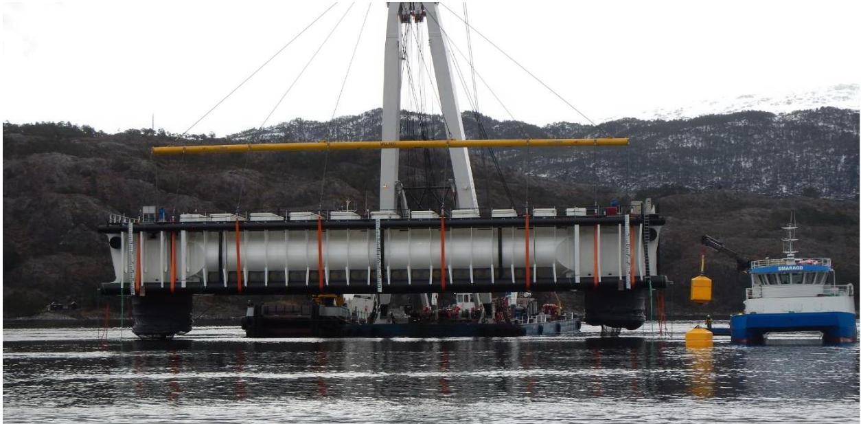
Figur 1 Tubmerd

Rapportering for 2016 i henhold til grønn tillatelse.