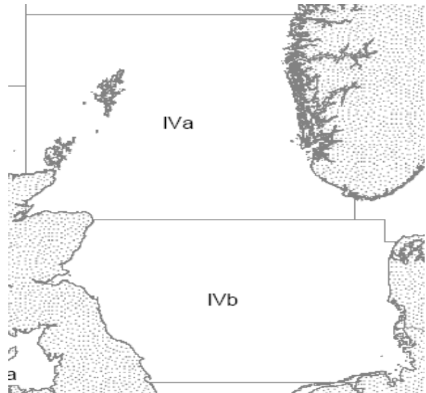
Tabell 1: Norsk kvote og fangst av rødspette i Nordsjøen i årene 2000 til 2008 (rundvekt tonn) 1

Under de bilaterale kvoteforhandlingene for 2008 fastsatte Norge og EU en totalkvote (TAC) på 49.000 tonn rødspette i Nordsjøen, hvorav Norge har en andel på 7 %. Etter kvotebytte med EU stod Norge igjen med en nasjonal kvote på 1.105 tonn rødspette for 2008. Av dette kan fartøy med bomtråltillatelse, nordsjøtråltillatelse og avgrenset nordsjøtråltillatelse fiske inntil 1.045 tonn, mens konvensjonelle fartøy kan fiske inntil 60 tonn. Trålfisket etter rødspette i Nordsjøen er regulert med maksimalkvoter. Det vil si at hvert fartøy kan fiske og lande inntil 420 tonn rødspette i 2008. Norsk kvote og fangst av rødspette i årene 2000 til 2008 fremgår av tabell 1 nedenfor.