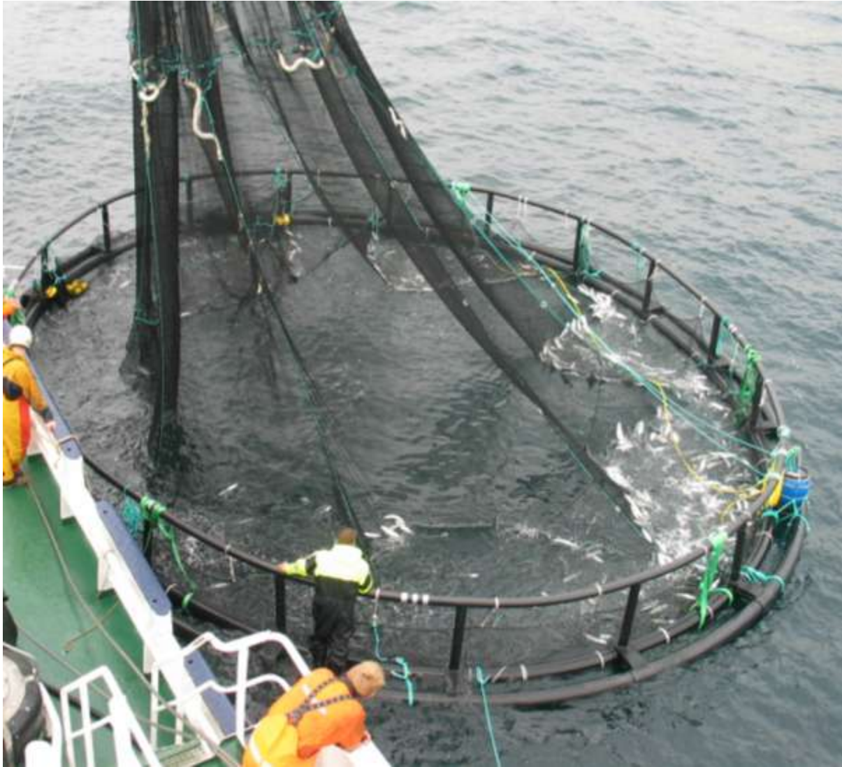
Figur 2. Delvis tørking av merd i 2. parallell i 2006.